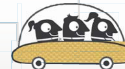
Formación de equipos